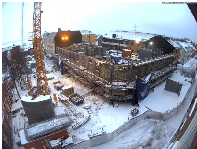
Överblick från webbkameran.

Platsledning, snickare, betongarbetare, utsättare, rörläggare, elektriker, murare