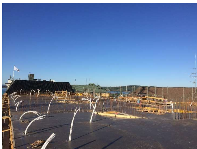
Sista lägenhetsplanet gjutet!

Följ bygget via vår webbkamera! Ni hittar länken på Arvika.se eller gå direkt till Webbkameror.se