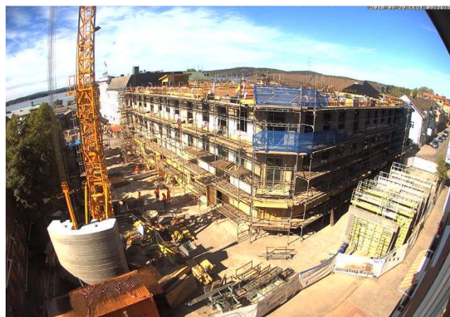
Överblick från webbkameran.

Platsledning, snickare, betongarbetare, utsättare Rör-, el-, vent-arbetare