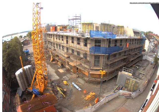
Överblick från webbkameran.

Platsledning, snickare, betongarbetare, utsättare Rör-, el-, vent-arbetare