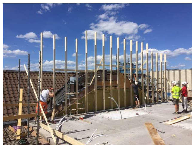
Reglad gavel mot fastighetsbyrån.