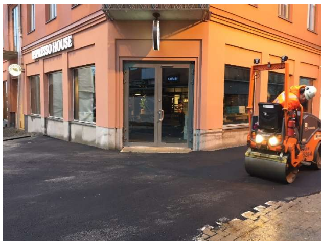
Asfaltering på Storgatan!