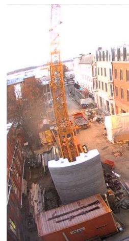
Överblick från webbkameran.

Platsledning, snickare, betongarbetare, murare, målare, Rör-, el-, vent-arbetare, plattsättare, golvläggare