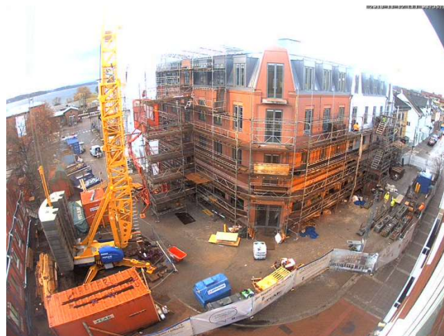
Överblick från webbkameran.

Platsledning, snickare, betongarbetare, murare, målare, Rör-, el-, vent-arbetare, isolerare, plåtarbetare, golvläggare