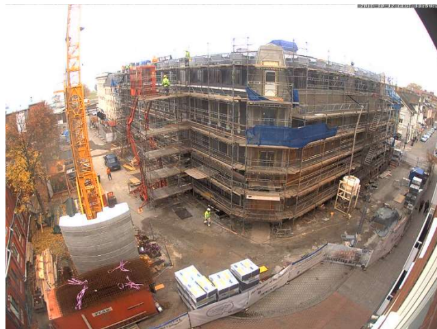
Överblick från webbkameran.

Platsledning, snickare, betongarbetare, murare, målare, Rör-, el-, vent-arbetare, isolerare, plåtarbetare, hiss-montörer