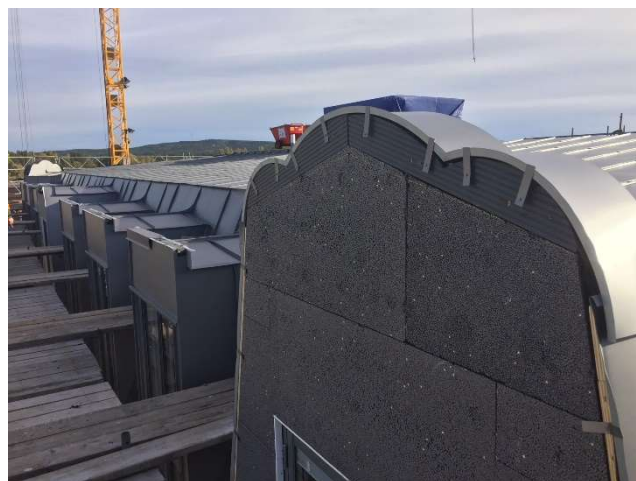
Takkupor redo för putsning.

Följ bygget via vår webbkamera! Ni hittar länken på Arvika.se eller gå direkt till Webbkameror.se