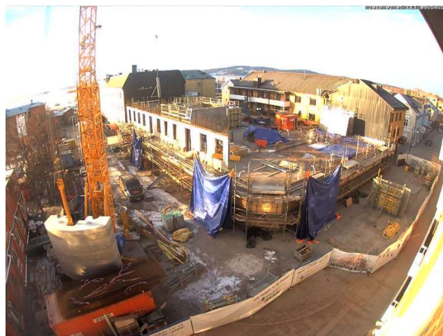
Överblick från webbkameran.

Platsledning, snickare, betongarbetare, utsättare, rörläggare, elektriker, murare