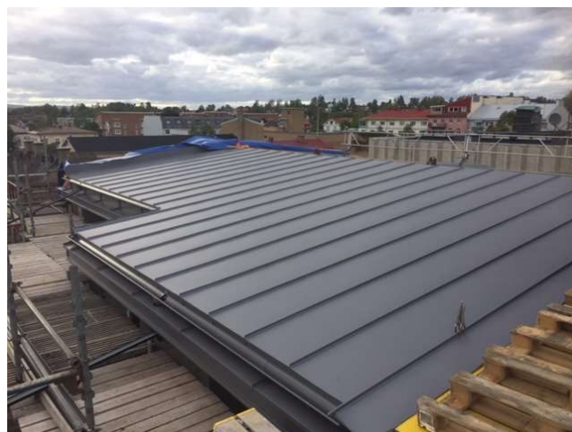
En del av taket klädd i plåt.