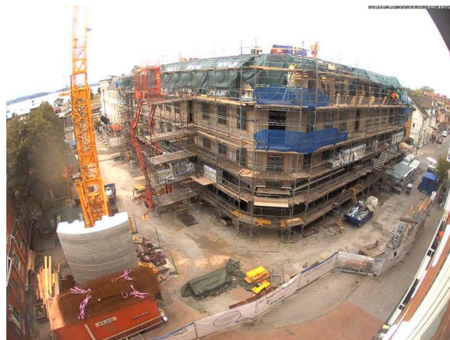
Överblick från webbkameran.

Platsledning, snickare, betongarbetare, murare, målare Rör-, el-, vent-arbetare